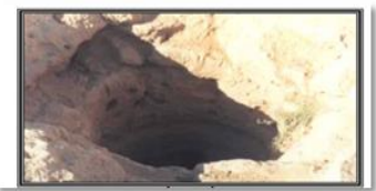
صورة (2) بئر شراف، المصدر: السعيد، الشبكة بين الماضي والحاضر، الطبعة 3، 2011، ص 264

3-4- بركة العمياء: تمتد على مسافة (15 كم ) او اكثر بعد بركة وأبار واكصة ، وهي بركة كبيرة الحجم ، مربعة الشكل تبلغ ابعادها (30*30 مترا) ، مليئة بالماء لها درج في شرقيها بعرض ستة أمتار ، ومصب البركة في الجزء الغربي الجنوبي ، وبجوارها ركامات