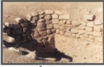
صورة (3) بئر واكصة، المصدر: السعيد، الشبكة بين الماضي والحاضر الطبعة 3، 2011، ص 264