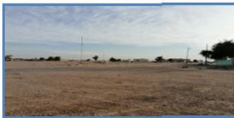
صورة (1) الوحدات السكنية في منخفض الشبكة

الأقصى في جنوب بئر واكصة (26 م) ثم يقل باتجاه الشمال الغربي (16 م) والجنوب الشرقي (6 م) ، تتكون من الجبس والكلس ومتحجرات (السعيد، 2011، ص80) ، يتركز وجود الكبريت في هذه الوحدة في الأماكن التي يوجد فيها الجبس والانهدرايت.