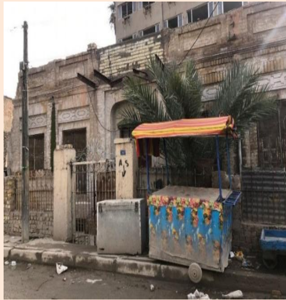
شكل (٢-١) نموذج للبيوت التراثية في المنطقة، الباحثة