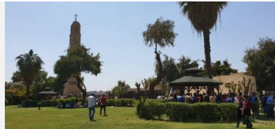
صورة (ز) عناصر الجلوس المسففه المشجعه للتجمعات والتفاعل الاجتماعي