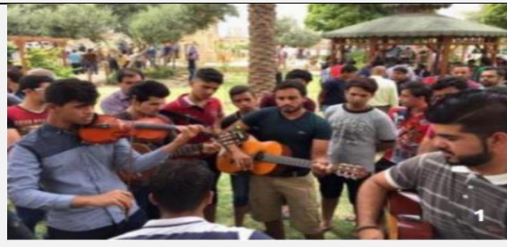
صورة (ط) فعاليات موسيقيه في الفضاء الخارجي للفنيله صورة (ي) عناصر الفضاء الخارجي تنسيقية وموجهة للفعاليات حول ساعة القشلة

شكل (١) صور توضيحية للعلاقات المادية والبشرية داخل فضاء القشلة