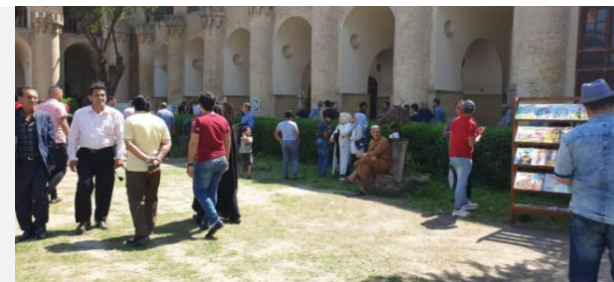
صورة (ب) علاقته الفضاء بالمبنى ووجود مسار انتقالي محجوز بسياج نباتي ونوزع المعروضات بمحاذاته

شكل (١) صور توضيحية للعلاقات المادية والبشرية داخل فضاء القشلة