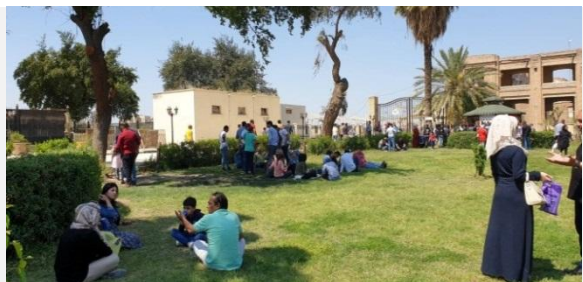
صورة (ا) علاقته الفضاء مع المبنى المجاور وعلاقته بفضائي من خلال بوابة