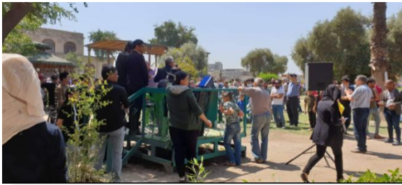
صورة (ح) منصه مؤفنه لعرض الخطابات والوجود الاعلامي