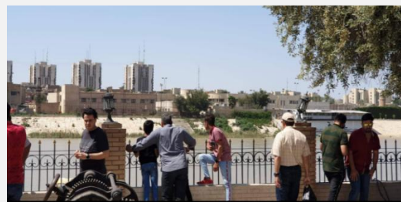
صورة (ج) ارتباط الفضاء بصريا بالنهر والضفة الأخرى، ووجود السياج كعنصر محدد وامني.