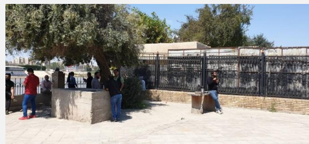
صورة (د) وجود مناطق محجوزة عين النهر، مع وجود توفيرات مختلفة مثل احواض الاشجار ذات ابعاد تشجع اشكال مختلفة من التفاعل المادي الاجتماعي