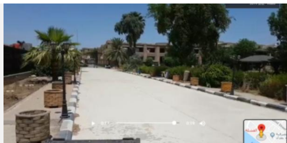
صورة (٥) أحد مسارات الفضاء وعناصر التنسيق المستعملة

بعد ان تم في الشكليات السابقين استعراض صور الفضاءات الخارجية لمبنى القشلة سوف يتم في الجدول (٢) استكشاف وتتبع وجود المكونات الفاعلة في الفضاء، حيث يظهر وجود مكونات مختلفة لامتجانسة فاعلة ولكل وبأنواع مختلفة. وفيما يتعلق بسمات الفاعلين فيمكن أن تعد ساعة القشلة عنصرا نصيبا ووالمبنى والانشطة هي الفاعل الاساسي في الفضاء الخارجي التي تتحكم بالرؤية المميزة للفضاء ، ثم تأتي في الدرجة الثانية كل من العناصر المعروضة المؤقتة او الدائمة مثل العربية الملكية، والعناصر النحتية، والفنون المعروضة، والاعمال اليدوية المعروضة للبيع، والعناصر الطبيعية التي تتخذ دورا داعما وتساهم في تشغيل وظيفة الفضاء تبعاً لخصائص الفاعل الاساسي